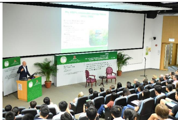
現場觀眾聆聽嘉賓的講解。

請參閱圖片庫下載高解像圖片： https://www.webcargo.net/1/sjSr5d6L54/ .